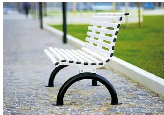
Afbeelding 3: voorbeeldbankje