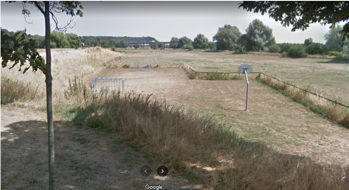
Afbeelding 7: Het voetbal- en basketbalveldje in de uiterwaarden bij de kruising van de Rijnstraat en Buitennomme.