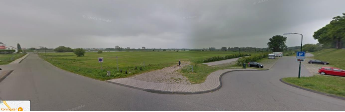
Afbeelding 9: Parkeerplaats langs de Veerweg, op de Veerwei.