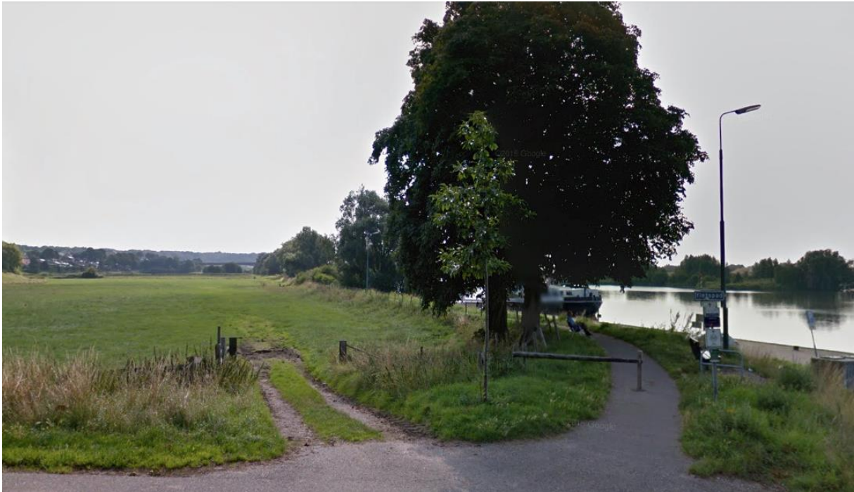
Afbeelding 6: Het Rijnkade pad in Rhenen

Het pad heeft een grote potentie door zijn strategische ligging en zijn prachtige omgeving. De enige manier om deze potentie volledig te benutten is door dit pad te vernieuwen en te verbreden. Alleen door op deze manier het pad aan te pakken zal het voor recreanten weer fijn en veilig voelen om gebruik te maken van dit pad.