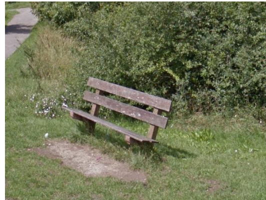
Afbeelding 2: bankje in Rhenen

Daarom zou een bankje, zoals die in afbeelding 3 staat weergegeven onze voorkeur hebben.